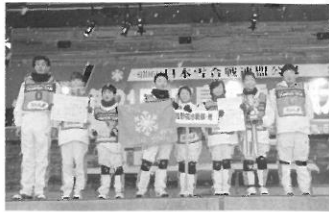
昨年度のジュニア優勝チーム