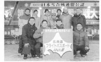
リーグ準優勝チームは、昭和南山国際雪合戦大会(北海道壮瞥町)へ!