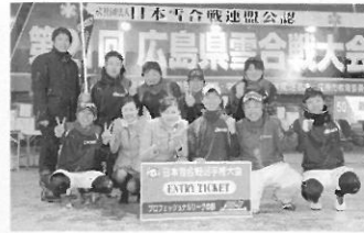
広島県大会の優勝チーム(リーグ及びレディースの部)は、日本雪合戦選手権大会(長野県白馬村)へ!