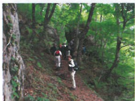
写真は比婆山登山のものですが。

所用時間：約2時間 コース：県民の森公園センター ～毛無山～公園センター ガイド：比婆山伝説ガイドツイハラの会 参加費：500円 30名程度まで