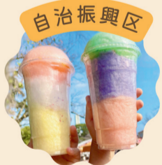
レインボーわたがし 焼きそば