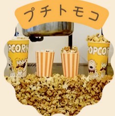
キャラメル ポップコーン