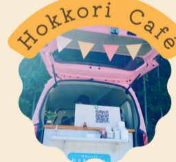
フランクフルト ジンジャエール