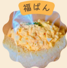
ふわふわ たまごサンド