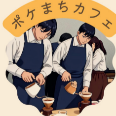
東高ブレンド コーヒー