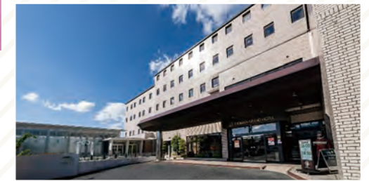
庄原グランドホテル 庄原駅から近く観光やビジネス拠点 としても多くの利用客が訪れるお宿