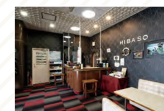
ホテル比婆荘 バックパッカーご用達のリーズナブルお宿