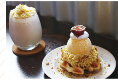
cafe cloud (SPACE BAR) 季節のスイーツやコリアン風ランチも楽しめるカフェ ◎庄原駅から徒歩で約10分 ※日曜定休

アップダウンもラクラクの電動アシスト付スポーツバイクを 庄原市内各所でレンタルできます