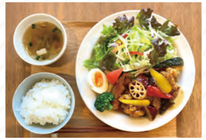
HOME SPRING くつろぎの空間黄色い外観がかわいいカフェ ◎庄原駅から徒歩で約7分