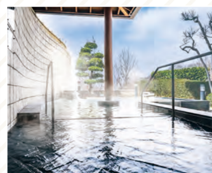
桜花の郷ラ・フォーレ庄原 宿泊はもちろん、食事や日帰り入浴もできるお宿