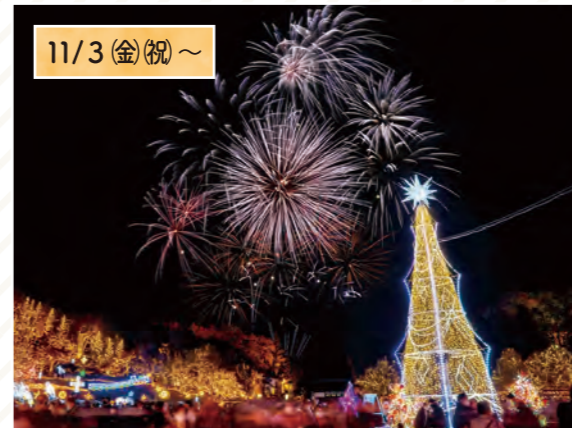
11/3(金祝)～ 国営備北丘陵公園「備北イルミ」 丘陵の地形と樹木を活かした装飾で 幻想的な光景が広がる庄原の冬の風物詩