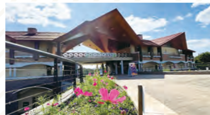
丘陵公園北口(里山の駅庄原ふりり) 国営備北丘陵公園の北口にある無料開放エリア