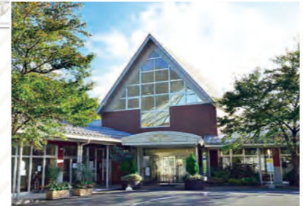
ゆめさくら(食彩館しょうばらゆめさくら) 「庄原の食」が一同に集まる交流拠点