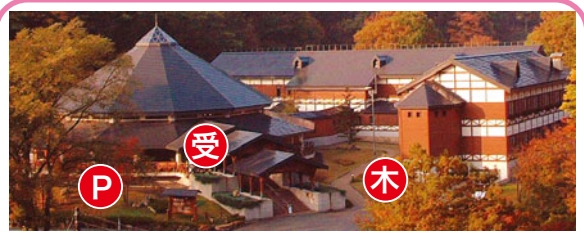
公園センター ○売店 ○入浴場有り

古事記伝説紙芝居 ●時間/①13:00~ ②15:10~ ③16:00~ (約20分) ●観覧無料