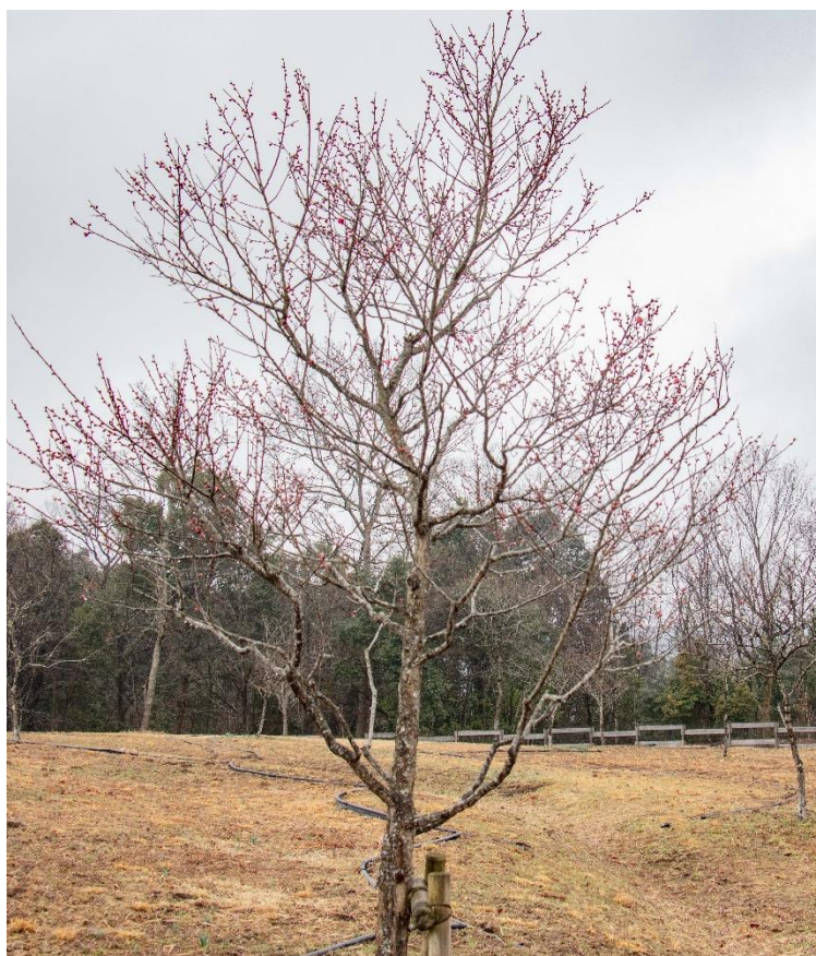
みのりの里「ウメ」 現在の開花状況 (2025年3月11日撮影)