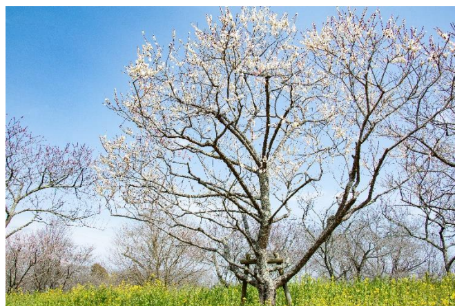
見頃時期のみのりの里「ウメ」の様子(2024年撮影)