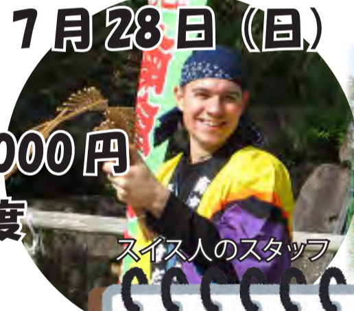
スイス人のスタッフ