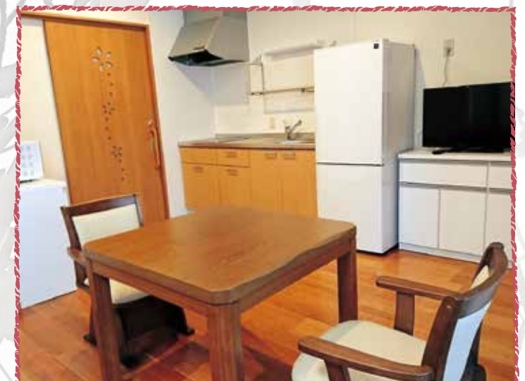
高齢者冬期安心住宅（比婆山）